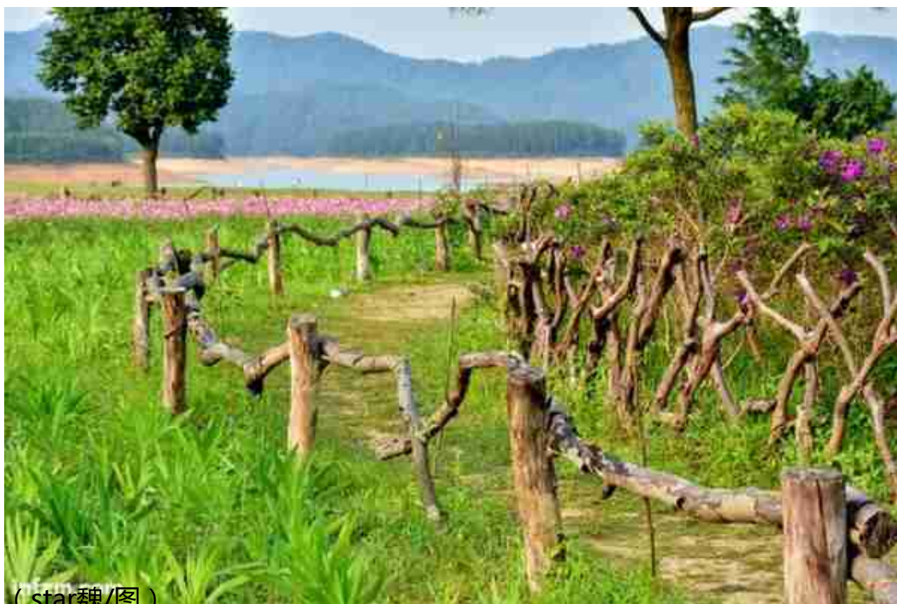
( star魏/图 )