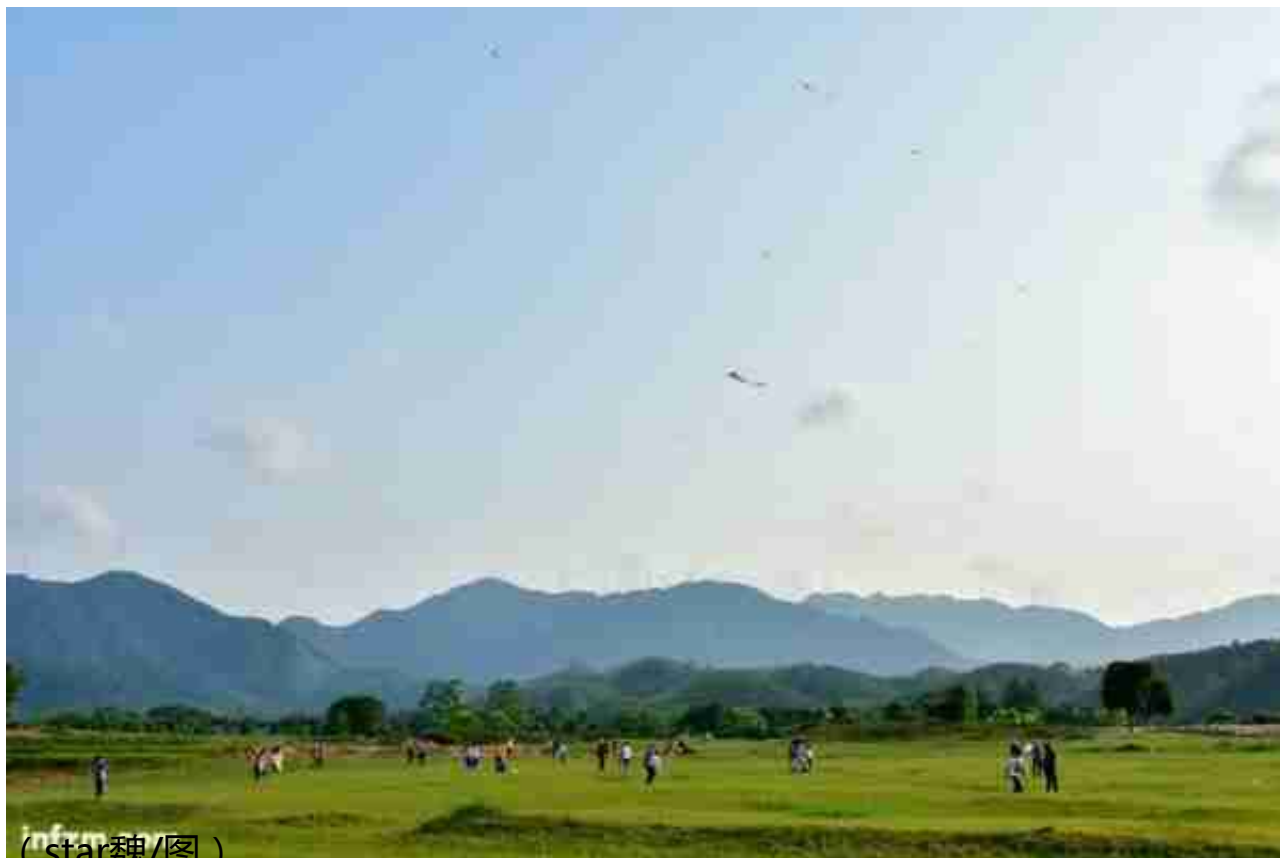
( star魏/图 )