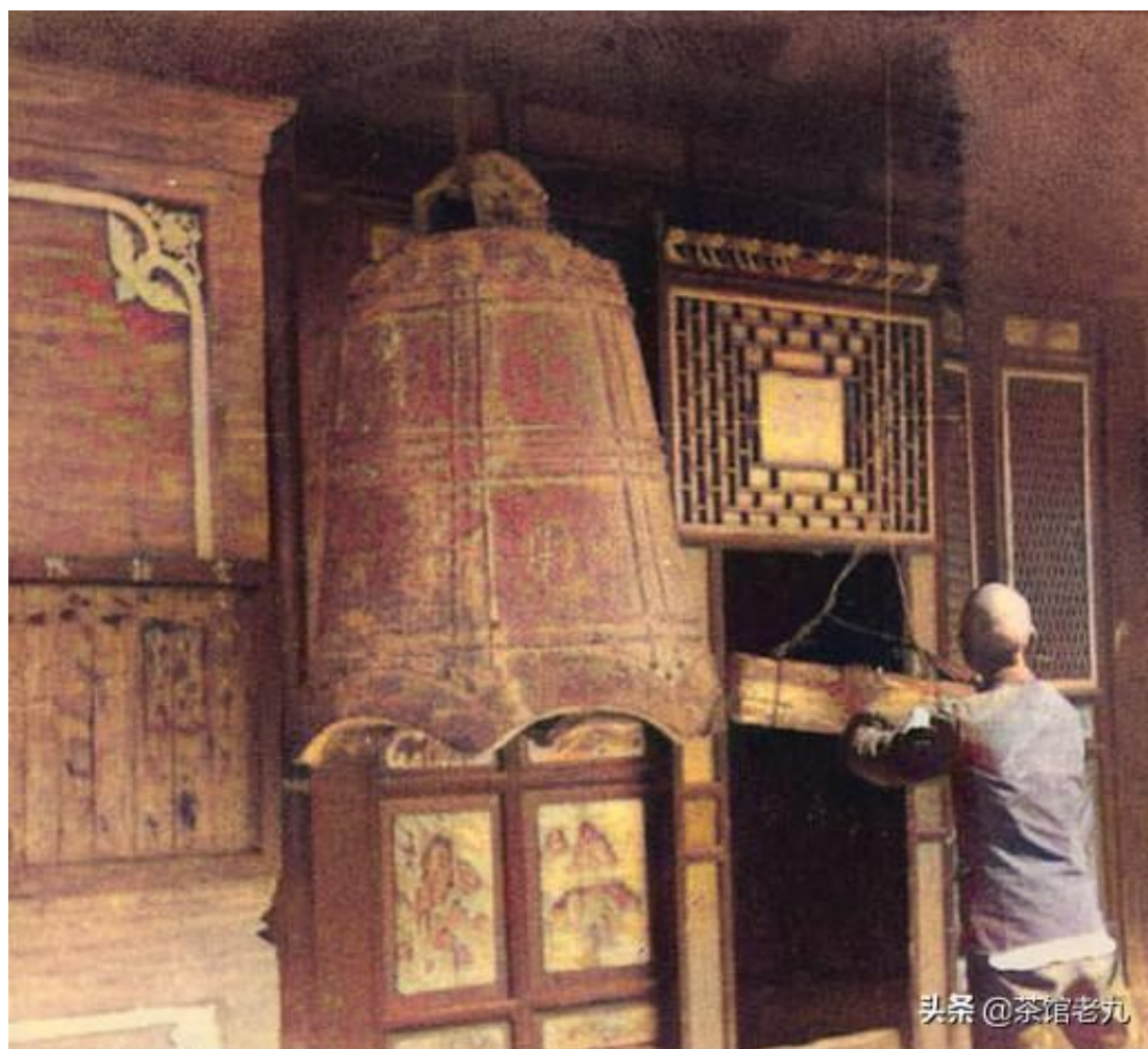
图为钟楼内的撞钟人。