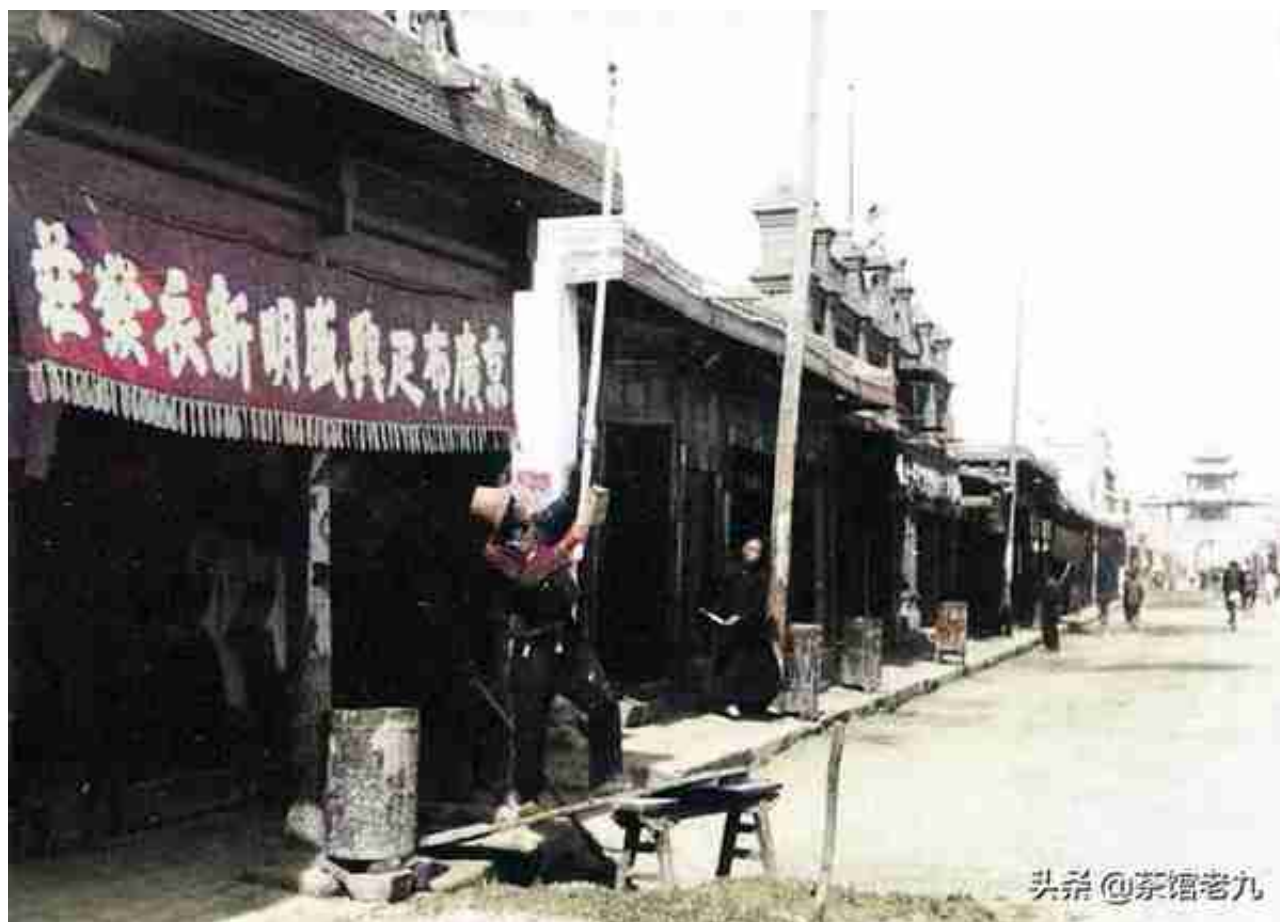
图为省城鼓楼的东西大街。