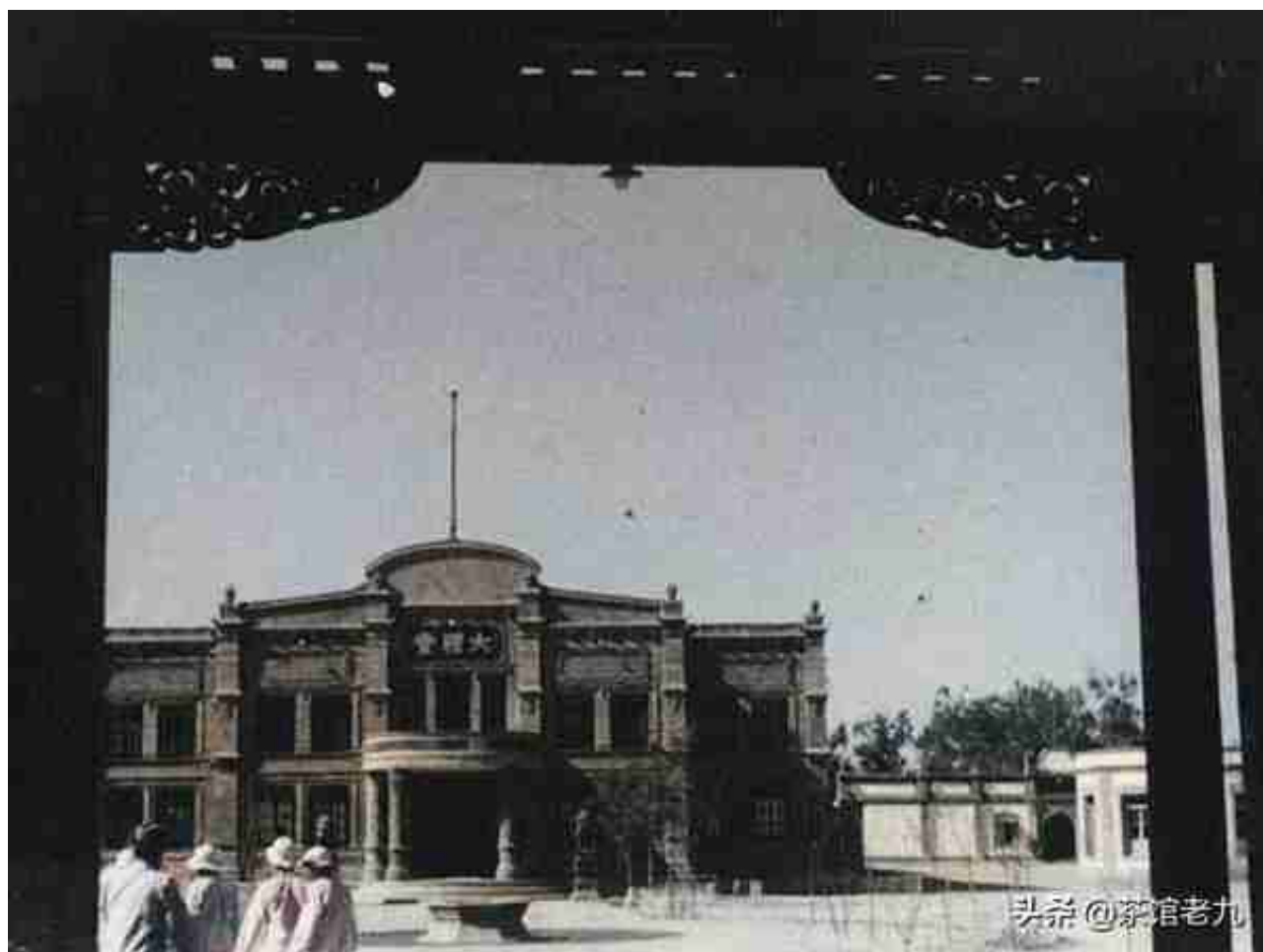
宁夏省政府大礼堂。旧址在今进宁北街沙湖宾馆的西南侧附近。