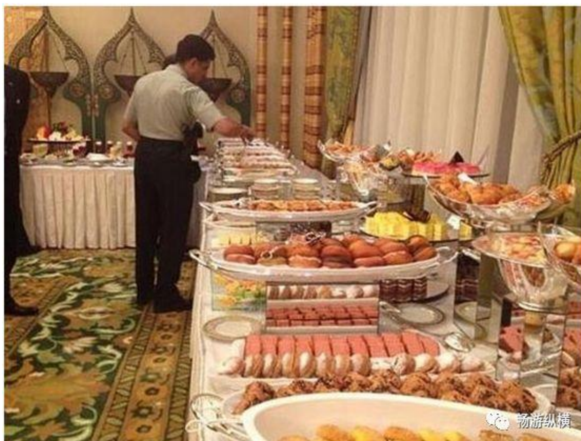
图为沙特沙漠宫殿自助餐