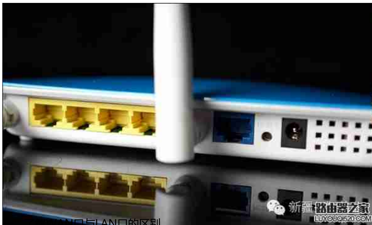
了解WAN口与LAN口的区别

熟悉网络的朋友都知道WAN是英文Wide Area Network的首字母所写，即代表广域网;而LAN则是Local Area Network的所写，即本地网(或叫局域网)。那么我们不妨给路由器上的WAN口和LAN口取一个中文名称，分别是广域网端口和本地网端口。