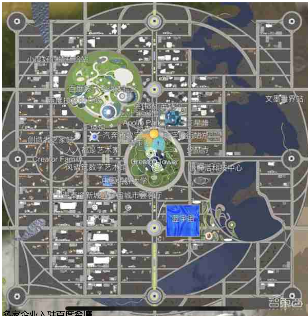
多家企业入驻百度希壤

在进入希壤之前，你需要给自己打造一个虚拟化身。不同于其他软件的只提供某种单一虚拟人物模型，希壤为用户提供了卡通、拟人和写实三种风格。