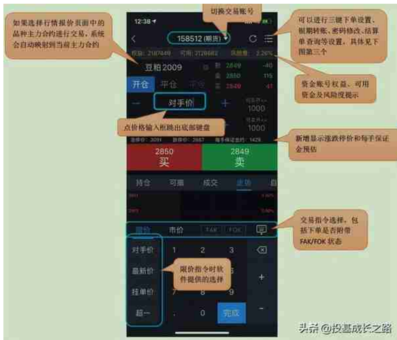
三键的开平仓界面