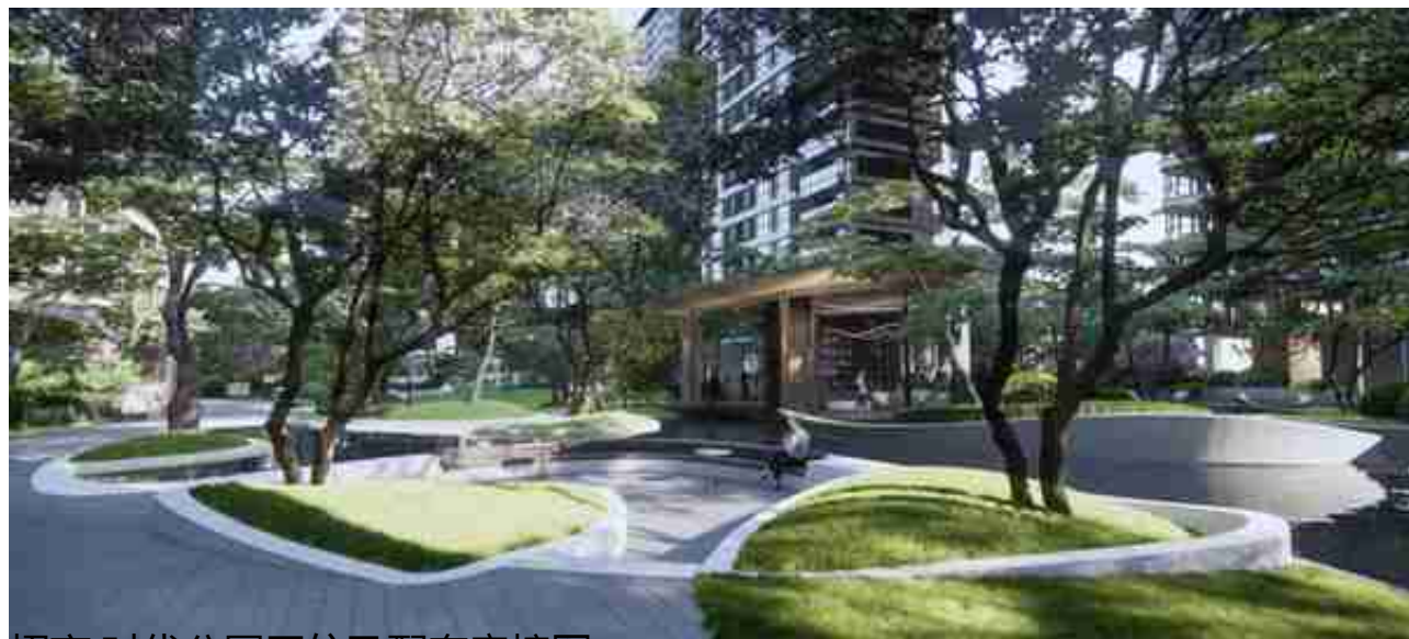
招商·时代公园区位及配套意境图

天府序作为承担这个超级项目高端居住部分的组团，依托大型复合型产城项目核心地段的价值优势，结合招商蛇口高端杰出的产品力，给成都买家一个不得不买的优质选项。