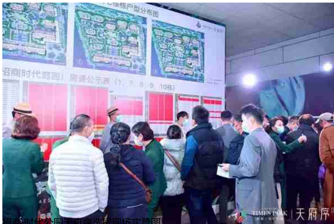
招商·时代公园天府序选房现场实景图

天府新区核心板块的高端项目行情是向左走还是向右走，天府序开盘的市场表现，可能会决定未来市场走势。