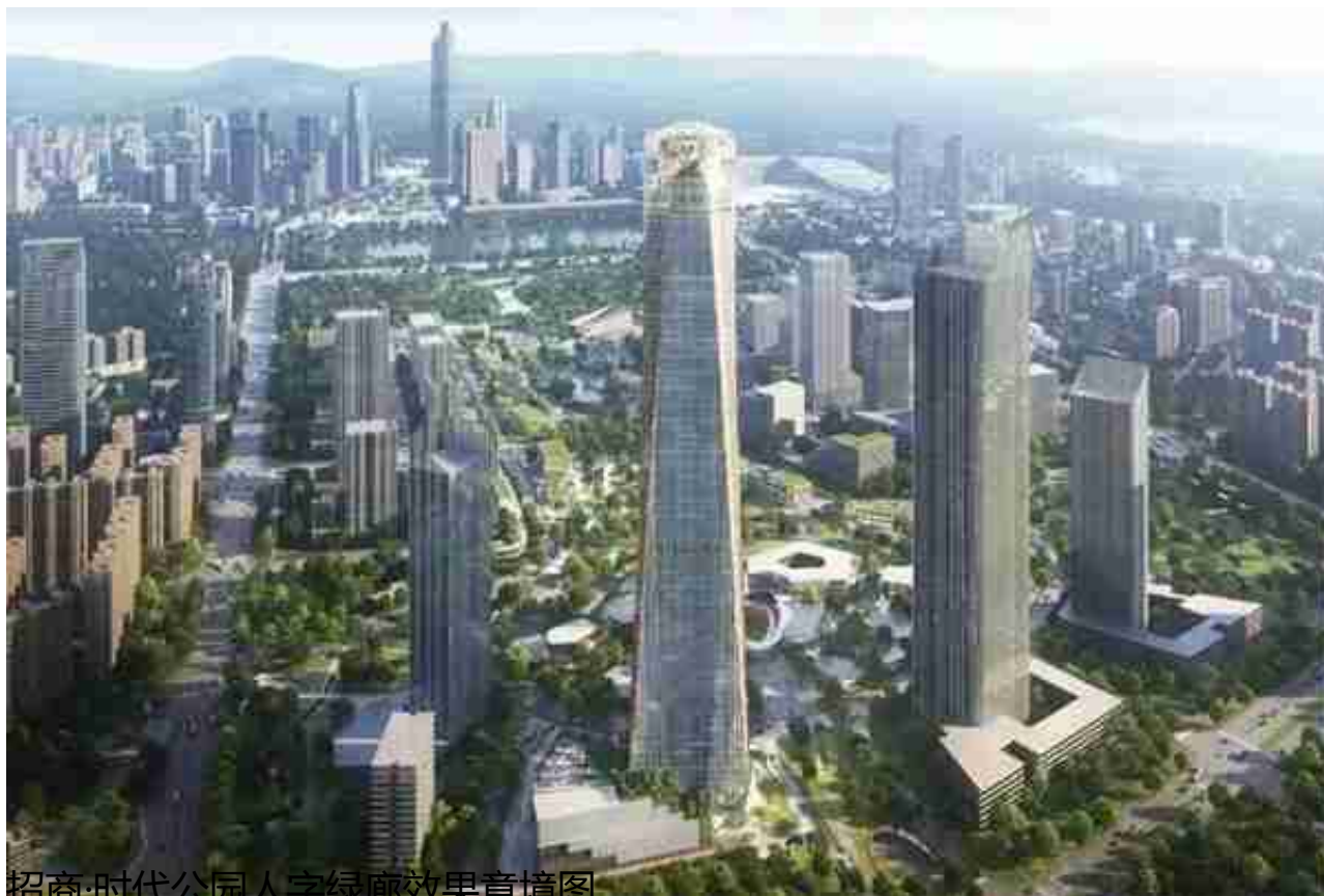
招商·时代公园人字绿廊效果意境图