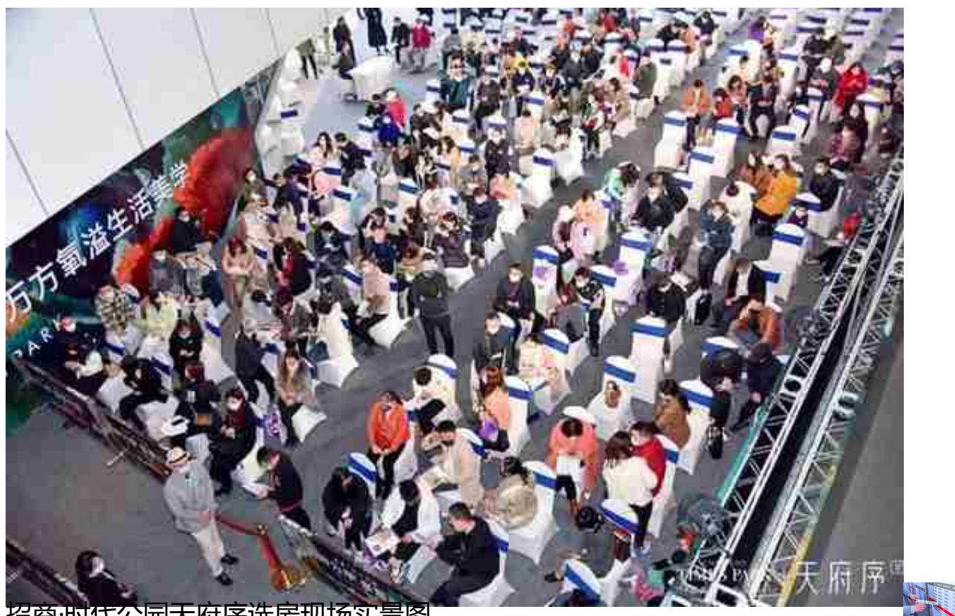
招商·时代公园天府序选房现场实景图

不少是一家老少一起到现场，工作人员给大家准备了早餐，很贴心。现场还是很有条理，进到内场后那种热烈的气氛现在想来都觉得血脉偾张。”