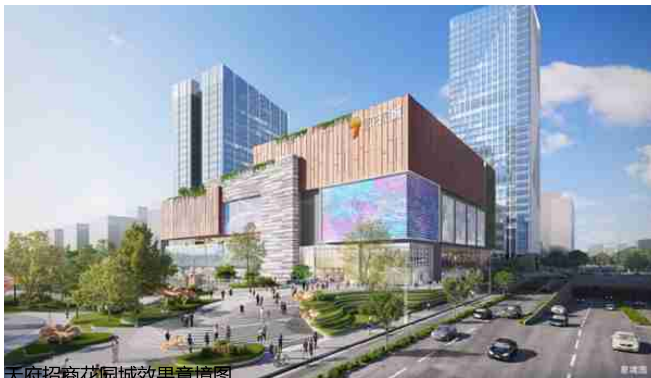
天府招商花园城效果意境图

招商蛇口今年在商业方面的表现非常突出，招商大魔方的商业正式开门迎客，同时还入驻九方购物中心，并更名为成都高新招商花园城；其次，是人字绿廊内，约有21万平方米的商业步行街；项目东南侧，还有一个规划的17万平方米商业综合体，以及体量庞大的开放式商业街。